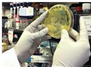
■ Vědec vyvíjející vakcínu proti Covidu zkoumá agarovou ploutňu

Zajímavá zpráva přišla také z Izraele, kde vědci šetřili podezření na souvislost mezi očkovací látkou od firmy Pfizer a zánětlivým onemocněním žláz, tedy střední vrstvy oční koule. Záněty