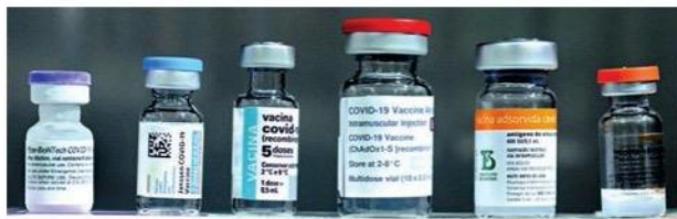
■ I přes určité problémy je očkování jedinou cestou, jak vrátit svět do normálního života