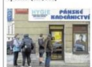
LOCKDOWN. Zákazníci čekají před kadeřnictvím.

Pokud se na testování začátek ve školách ukáže, že je mezi nimi jen málo nakažených, měla by vláda podle opozičního postance a lékaře Vlastimila Válka (TOP 09) rozhodnout o tom, aby děti nemusely nosit roušky a testovat se proto, aby mohly chodit na školky. Po testování ve školách by se podle Válka také měl zrušit pandemický stav. Pokud s tím nepojde vláda, navrhne zrušení podle Válka opozice. (tkt, red)