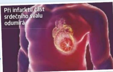
Při infarktu část srdečního svalu odumírá