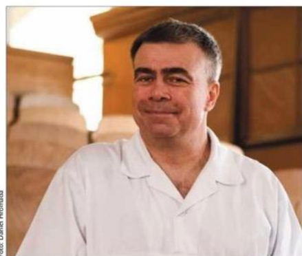
„Vakciny mRNA nás překvapily svojí bezpečností. Uvážíme-li, kolik vedlejších reakcí mají lidé po jiných očkováních, například před cestováním do zahraničí, pak vychází srovnání s vakcínou na covid-19 jednoznačně příznivě,“ říká předseda českých kardiologů Aleš Linhart.

Na internetu se šíří zprávy o tom, jak pacienti po očkování vakcínou na covid-19 plní ambulance kardiologů. Nejčastěji prý tyto lidé končí v nemocnici kvůli zánětu srdečního svalu. Ten může v konečném důsledku vést až ke smrti pacienta. Spousta lidí se proto z důvodu obavy o své zdraví odmítá naočkovat. Kardiologové se rozhodli tyto zprávy vyvrátit. Jde podle nich o lež. Schválené očkovací látky jsou prý bezpečné a chrá-