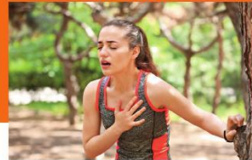
Připravila: bla

Počet náhlých srdečních zástav a poškození srdce nebo nečekaných úmrtí mladých sportovců mají pomoci snížit nová centra sportovní kardiologie. Vyúžit je mohou vrcholoví i amatérští sportovci.